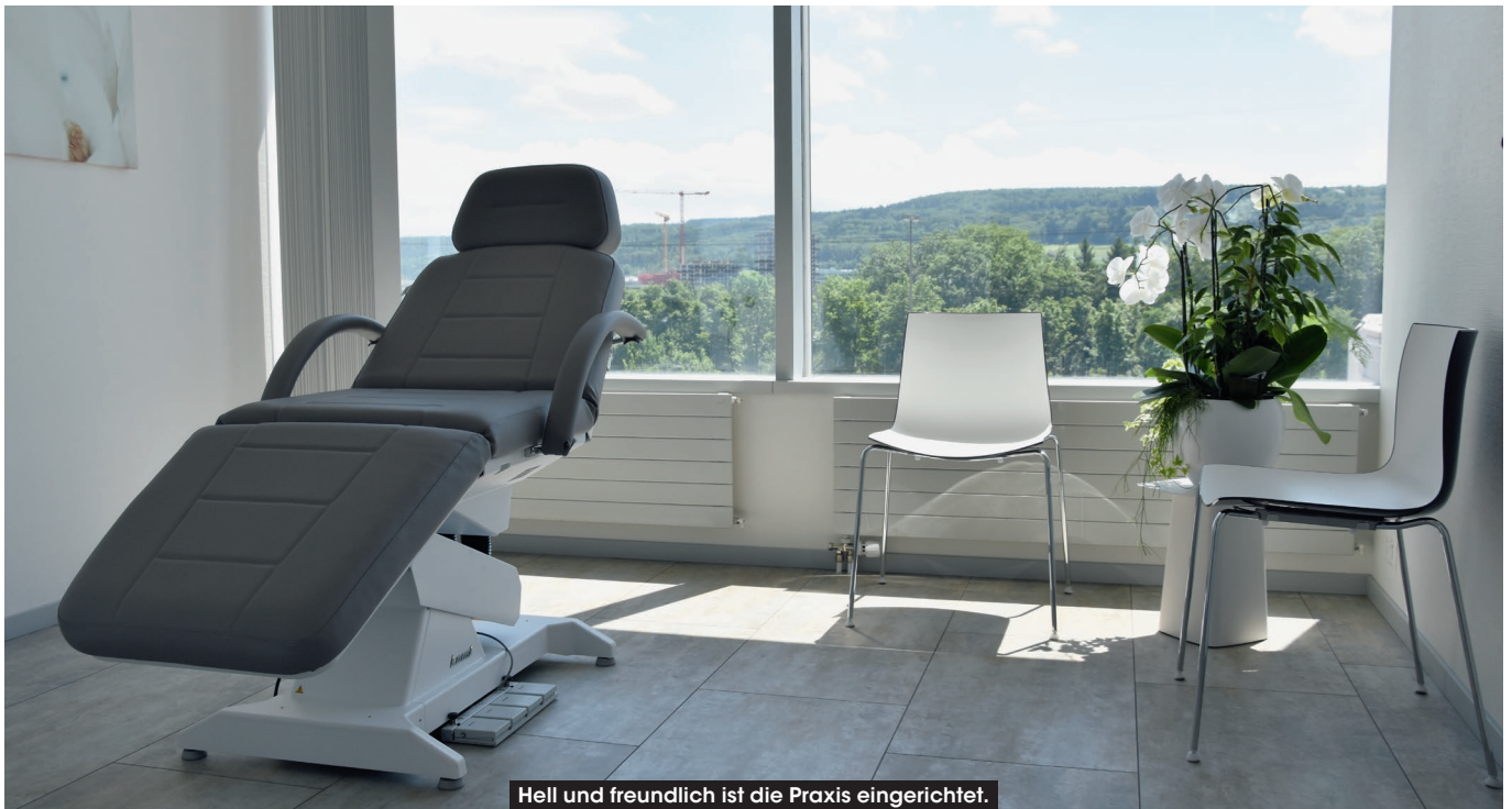
Heil und freundlich ist die Praxis eingerichtet.